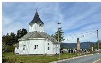
Bilete: Årdal kyrkje av Susanne Hegenscheidt