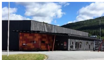
Bilete: Byglandshallen av S. Hegenscheidt

Idrettshallene blir sommarstengde for organiserte aktivitetar i skuleferien. I Byglandshallen vil styrkerommet vere ope som normalt. Enkeltarrangement i avtale med skuleleinga på oppvekstsentra.