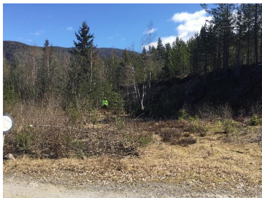
Lenge sidan uttak her

Uansett må slike ynskjer vere fremja før planforslag med KU blir lagt ut til høyring og off ettersyn.