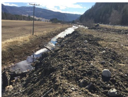
Uavklart massedeponi i bruk

Nokre utgåtte / avslutta / uavklara masseuttak bør kunne regulerast som mottakarar av reine overskottsmassar. Det vil kunne gi inntekter til grunneigarane samstundes som inngrepa blir reparerte.