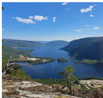
Ellingsknuten, Ellingstjønn.