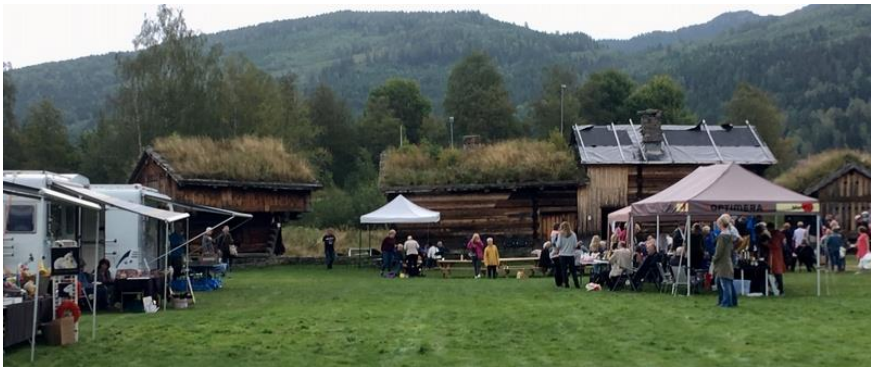
Bilete: Lislefarm på Presteneset 2018.

21. - 30. juli Området er booka av Bygland luftsportsklubb (Gamaveka Extreme)