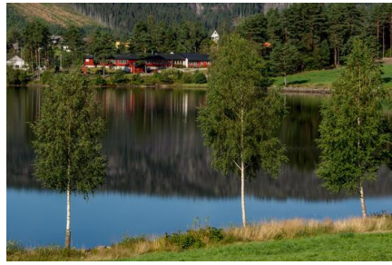
Bilete: Vassendkilen med Byglandsfjord oppvekstsenter i bakgrunnen.

Drift og forvaltning og Vassområdekoordinator – Otra Vassområde har i løpet av juni tatt vassprøver av badevatnet ved Tangen og Vassendkilen. Resultata viser at badevatnet på både plassane oppfyller dei høgaste krava til badevasskvalitet.