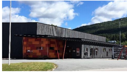
Bilete: Byglandshallen av S. Hegenscheidt

Byglandshallen og Årdalshallen blir sommarstengde for organiserte aktivitetar i skuleferien. Tida blir nytta til periodisk og årleg reinhaldsoppgåver og gir moglegheiter for ordinær sommarferieavvikling.