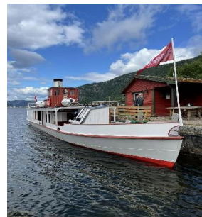
Bilete: Bjoren på Byglandsfjord.

Bjoren-bilete i Facebook kalenderen til Bygland for veke 27/2023 er tatt av Mark A. Lee. Mark er norsk-amerikanar frå Gully i Minnesota, USA, med forfedre frå Bygland (Øvre Kvaale), Åraksbø (Lidtveit/Rom) og Ose (Fosslid). Han er på tur for å finne garden og husmannsplassen der tippoldefar og tippoldemor reiste ifrå, da dei emigrerte til Amerika seint på 1800-talet.