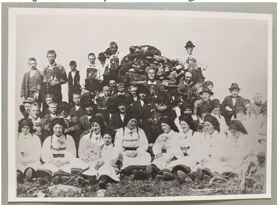
Rustfjøddvarden.