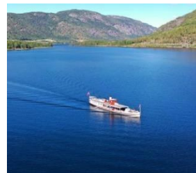
Bilete: Bjoren.