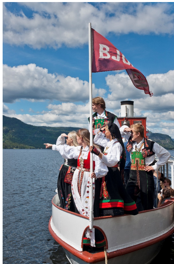
Stø kurs

Samla sett gjev planforslaget ein reduksjon i CO 2 -utslepp på om lag 82% basert på Miljødirektoratet sin metodikk.