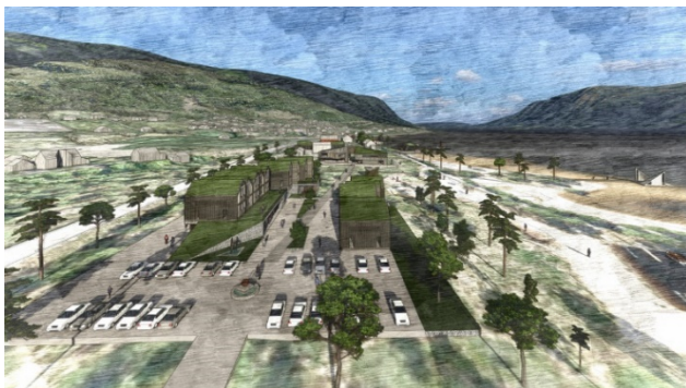
Konseptskisser frå moglegheitsstudien for Presteneset, Henning Larsen Architects AS

Bygland kommune er rik på mineralressursar og har fleire masseuttak spreidd i heile kommunen. Ved alt anleggsarbeid oppstår det overskotsmassar som må bli tatt hand om. Dette er belastande for miljøet og samfunnet, blant annet på grunn av behov for areal til deponering, støv, støy og klimagassutslepp frå transport. Det behov for å sjå på forvaltning av overskotsmassar gjerne i samanheng med masseuttak.