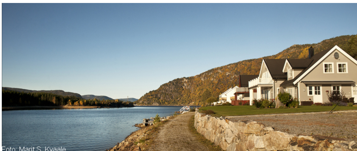
Turveg på Byglandsfjord

Klimaet blir varmare, våtare og villare og ekstremvær vil inntreffe oftare. Dette aukar belastninga på kritisk infrastruktur som kraftforsyning, elektronisk kommunikasjon og vegnett. Det krev også auka omsyn til naturfare ved nye tiltak.