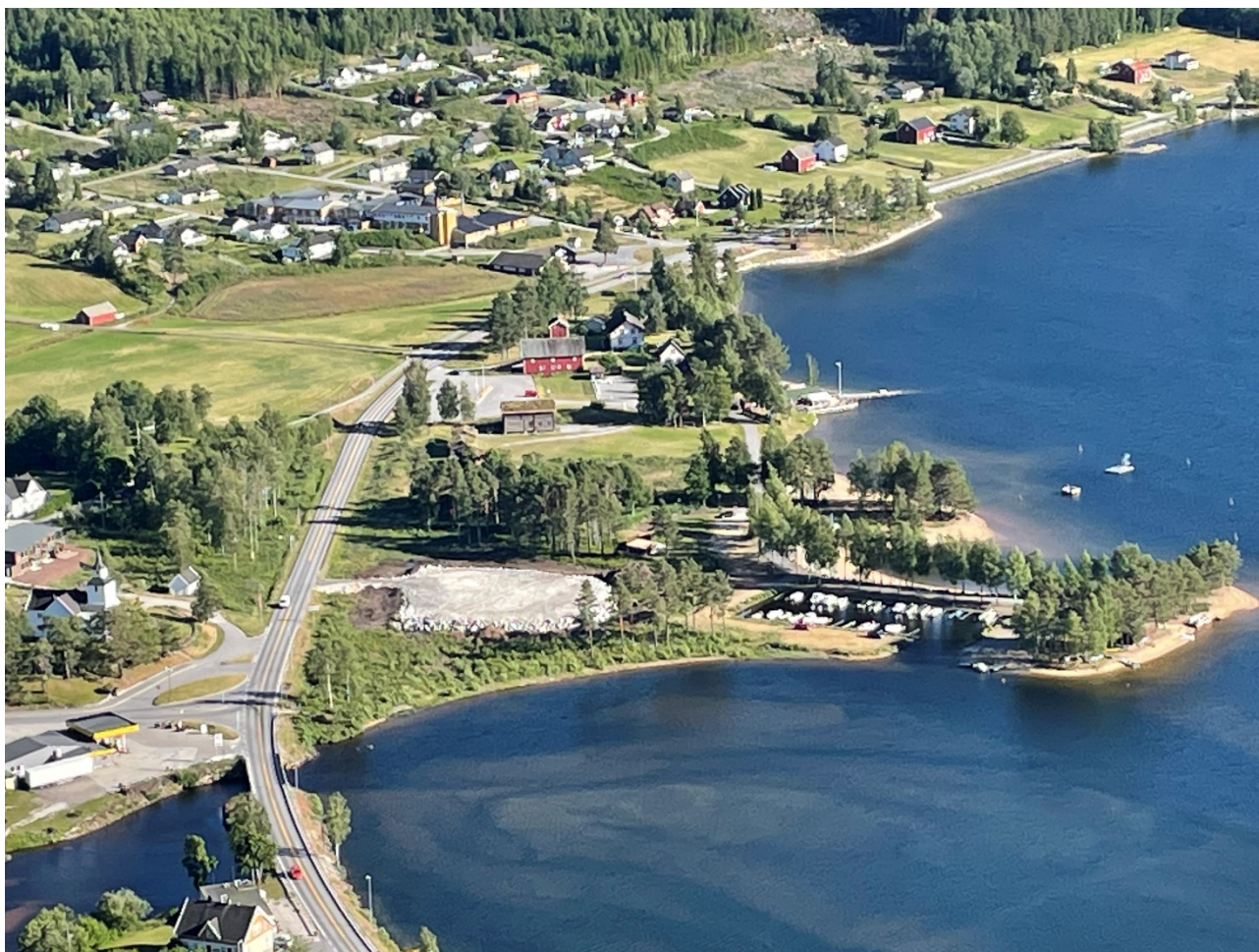
Realisering av planreserve på Presteneset

naturmessig verdi, noko som er negativt med omsyn til overordna føringar. Gjennom detaljregulering vil det vere mogleg å legge føringar om at dyrka mark skal tas i vare eller alternativt bli erstatta. Det er område med dyrka mark som gror til i kommunen, og desse har eit potensiale for reetablering.