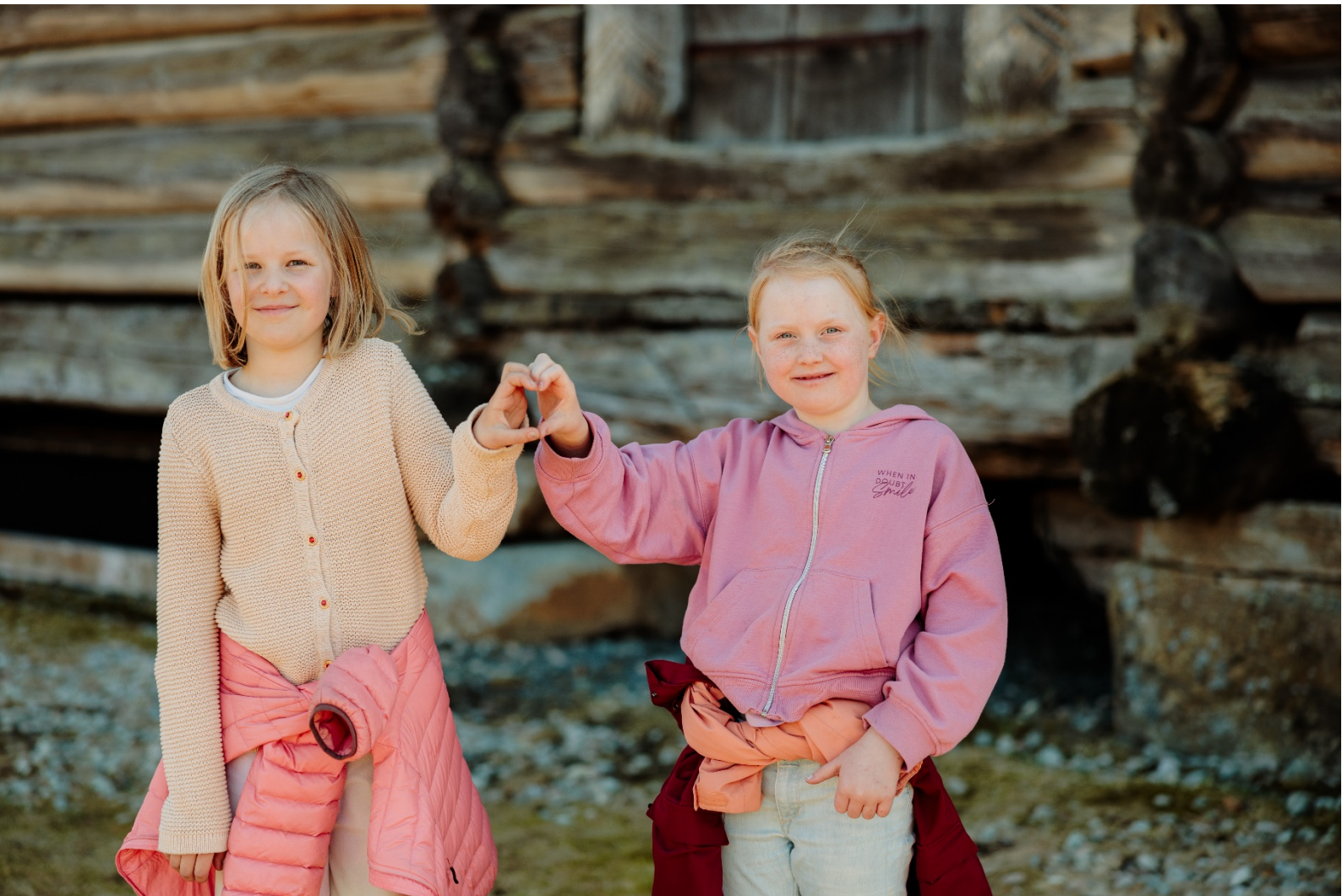
Med hjarta i Bygland