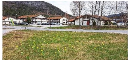
Bilete: Nyplanta påskelilje i Bygland sentrum.

Vi takkar elevane og lærarane for denne fine dugnaden. 😊