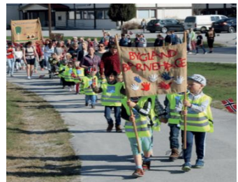
Bilete frå barnetoget 2019.

Barnehagen og Bygland skule 1.-10. klasse gjeng i tog frå skulen kl. 09.45, måndag 8.mai. Det blir tale frå 2 av årets 10. klassingar og nedlegging av blomar ved bautaen. Alle som ynskjer å møte opp for å markere denne dagen er hjarteleg velkomne til å vere med.