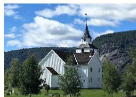
Bilete: Bygland kyrkje.