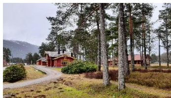
Bilete: Byglandsfjord stasjonsområde.

Innspela vil bli brukt i arbeidet med ein moglegheitsstudie og endring av reguleringsplan. Vel møtt til ein triveleg og inspirerande kveld!