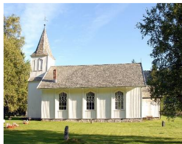
Austad kyrkje.