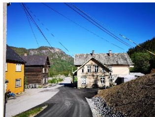
Ose sentrum.