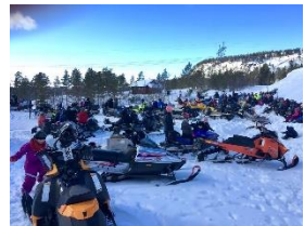
Friluftsgudsteneste ved Hovatn