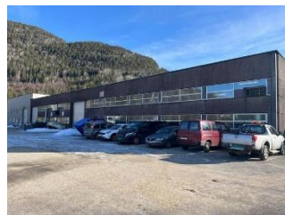
Nesodden Industribygg.

Interessentar vert bede om å sende ein søknad og kan bruke vedlagte forretningsplan som mal. Interessentane må og opplyse i søknaden om prisen dei vil betale for aksjane. Interessentar står fritt til å take bort dei delane av forretningsplanen som ikkje er relevante. Bedrifter som søker må kunne vise til solid finansiell berevne og ha ein plan på korleis dei skal