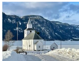
Sandnes kyrkje, Åraksbø.

For nokre år sia overtok kyrkjevevja sjølv rekneskapsføringa som kommunen tidlegare hadde hatt, og dette tilførte fellesrådet kr. 50.000,- ekstra per år. Alt som dette har gjeve av meirinntekter og besparingar, har gått rett inn i vedlikehald av kyrkjene, og dei siste 15 år er det gjennomført