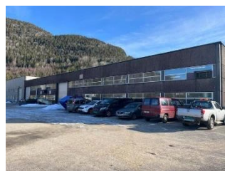
Bilete: Nesodden Industribygg. Fotograf: Bygland kommune