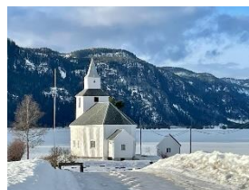
Sandnes kyrkje, Åraksbø.

sundag 12.03. kl. 15.00, Åraksbø grendehus Årsmelding og sak om justeringa for høgmessa. Årsfest med servering.