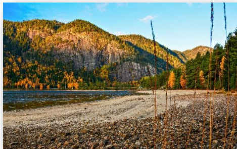
Gullstrand i Bygland.