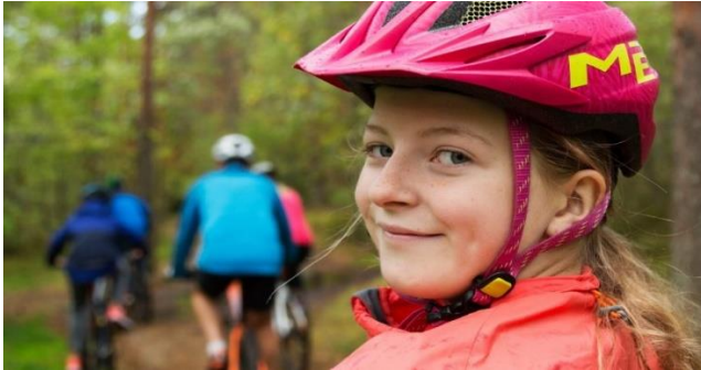
Bilete: Friluftslivets veke 2022

Vi feirar norsk natur og friluftsliv gjennom ei heil veke. Vi inviterer heile Noreg til å bli med ut på tur!