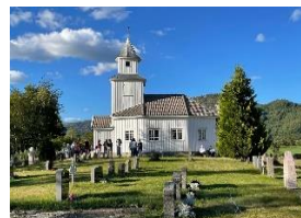
Bilete: Sandnes kapell.