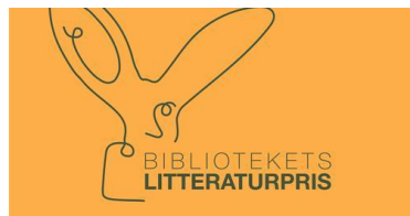
Bilete: Bibliotekets litteraturpris

10 bøker er nominerte til Bibliotekets litteraturpris – ein heilt ny pris som frå og med 2022 vil bli delt ut årleg. No utfordrar vi deg som bokelskar og ivrig lesar: