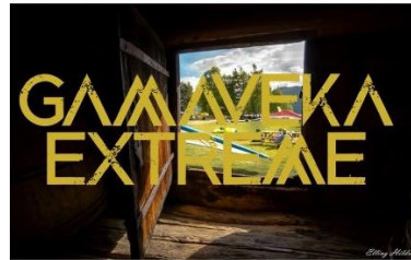
Bilete: Gamaveka Extreme