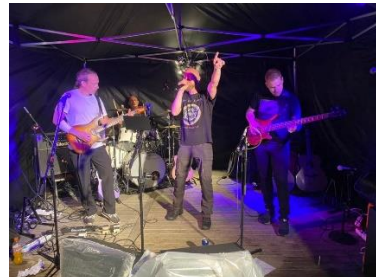
Bilete: Bjoren Brygge