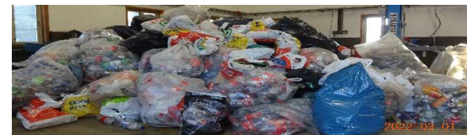
Bilete: Olav Skeie

9. klasse (2021/22) takkar og så mykje for velvilje, og medverknad til innsamlinga 28. februar og 8. november i fjor.