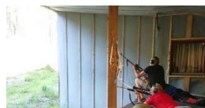
Billete: Bygland Skyttarlag