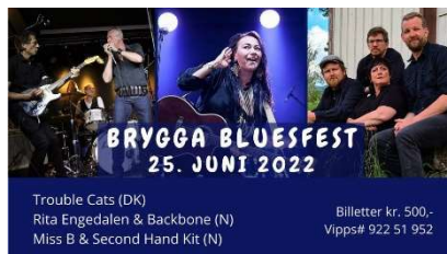
Plakat: Bjoren Brygge