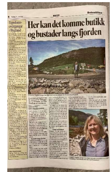
Setesdølen, 31.05.2022, s. 6

Tomta på Presteneset er no under arbeid, og kjem til å vere sjåande slik ei tid framover. Budsjettet for prosjektet er på 1,2 millionar kroner. Sidan området har noko ustabil grunn, vert det lagt på ei overfylling for å