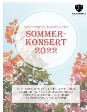
Plakat: Kulturskolen i Evje og Hornnes og Bygland

Bygland Skyttarlag: Skyting på riflebanen ved R9, Bygland, kvar torsdag kl. 18.00. Skyting til storvilt prøve og trening.