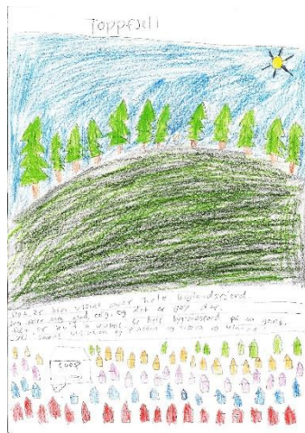
Bilete: Ronja frå Byglandsfjord

Bygland kommune er godt i gang med revidering av kommuneplanen. Difor har vi i 2019-2021 hatt ei rekke medverknadsaktivitetar der innbyggjarane, næringsliv og frivillige organisasjonar har vore involvert. På kommunen si heimeside kan du sjå kva for innspel som har kome så langt. Det er planlagt nokre aktivitetar til før vi set strek for innspelsmøte. Vi vil minne om at fristen for å kome med innspel til arealdelen er 15. oktober .