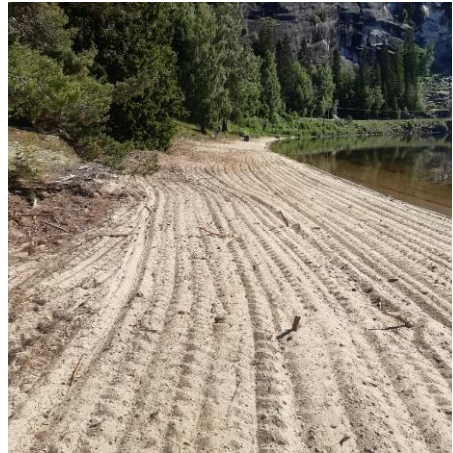
Bilete frå avfalls- og krypsivrydding ved Åraksfjorden.