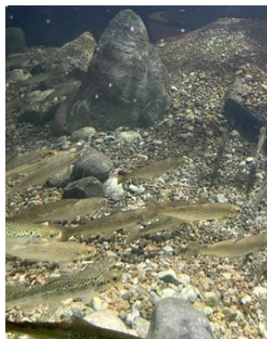
Ein kopie av gyteplass dei har laga i Akvariet