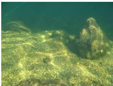
Restaurert gyteplass ved Vassenden