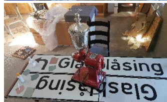
Kafebord laga av dei gamle skiltene som viste vegen til tidlegare Glashytta