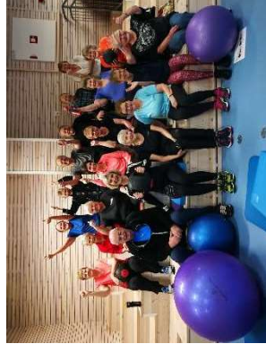
Aktive deltakar i Stryketrening på Bygland

samlinga. Me håpar på fleire gode opplevingar med betre folkehelse som fokus.