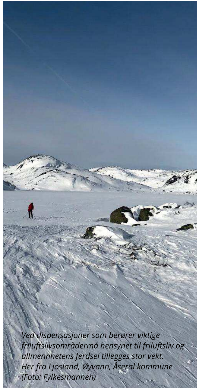
Ved dispensasjoner som berører viktige friluftslivsområder må hensynet til friluftsliv og allmennhetens ferdsel tillegges stor vekt. Her fra Ljosland, Øyvann, Åseral kommune

Etter § 19-2 første ledd står det at kommunen kan gi dispensasjon. (Forutsatt at de to vilkårene for å kunne gi dispensasjon i § 19-2 andre ledd er funnet oppfylt). Det vil si at ingen har krav på å få dispensasjon. Det forutsettes imidlertid at kommunen må ha en saklig grunn for å ikke gi dispensasjon og som ikke kan avbøtes gjennom dispensasjonsvilkår. For eksempel kan kommunen la være å gi dispensasjon dersom de vil se saken i en større sammenheng, i ett område hvor det har vært mange dispensasjoner. Da bør det fortrinnsvis utarbeides ny plan før ytterligere tillatelser kan gis.