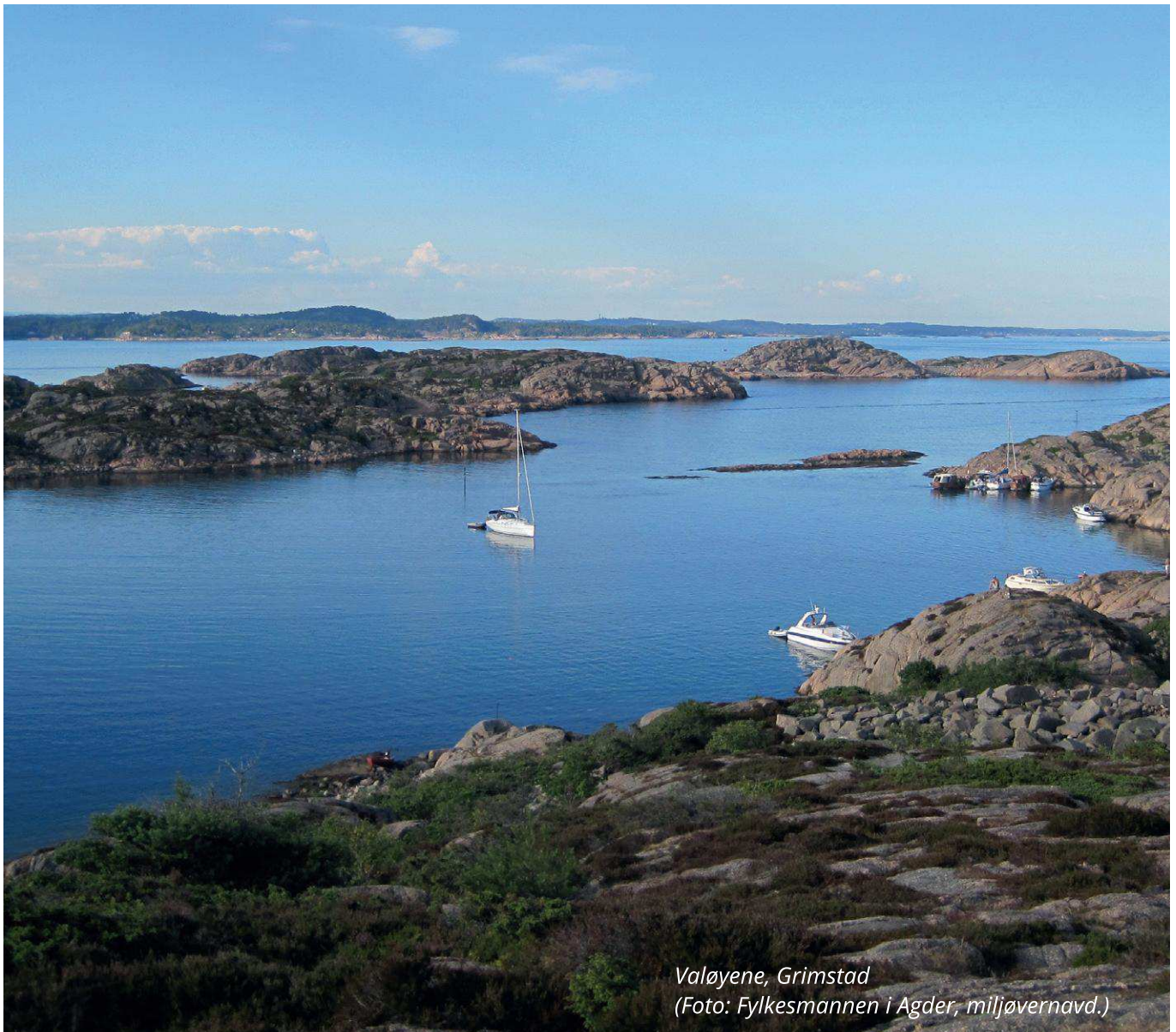
Valøyene, Grimstad

Er det dispensasjon fra kommuneplan eller reguleringsplan? Jo mer detaljorientert og finmasket plan, jo mer skal til for å dispensere.