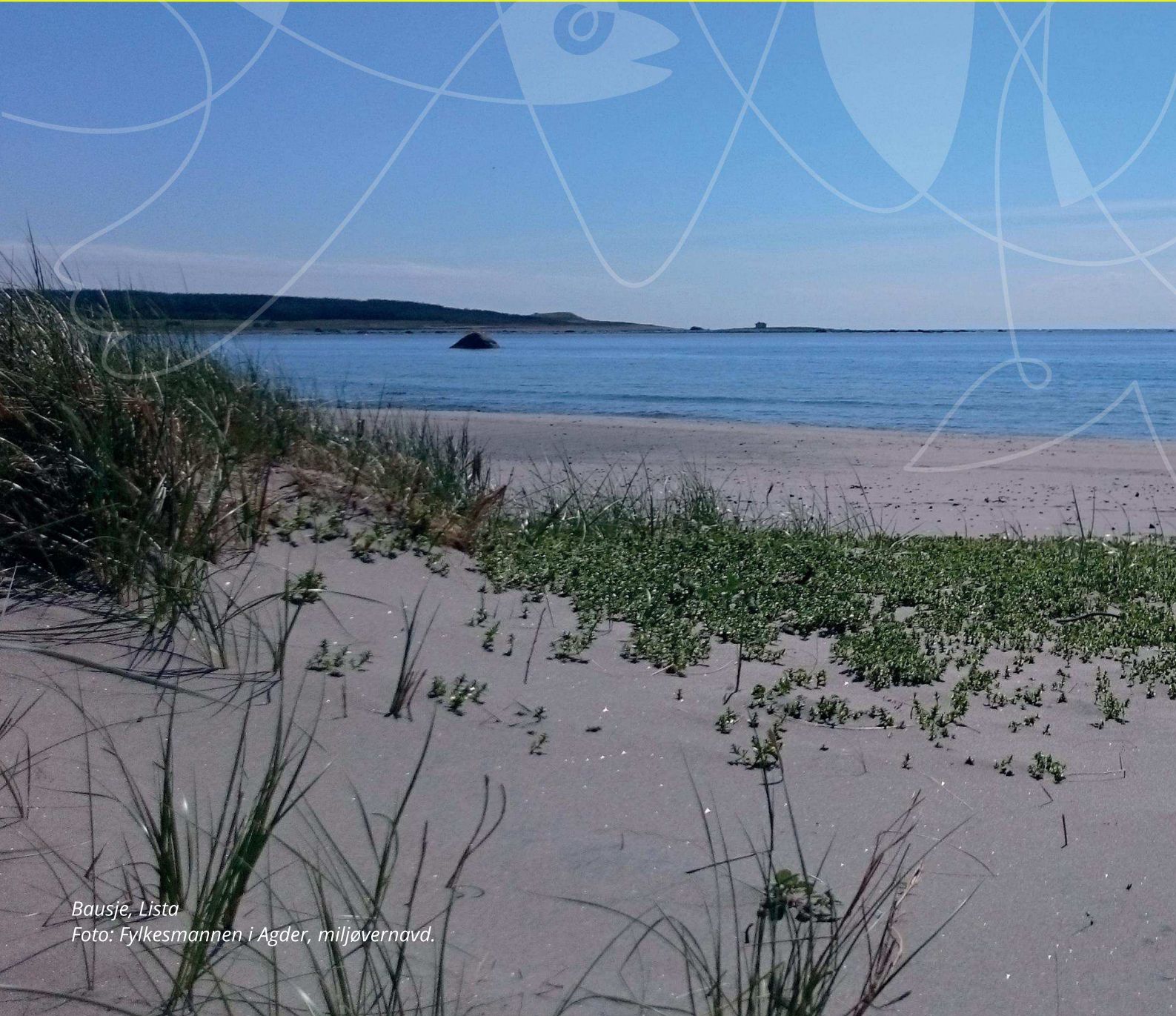
Bausje, Lista