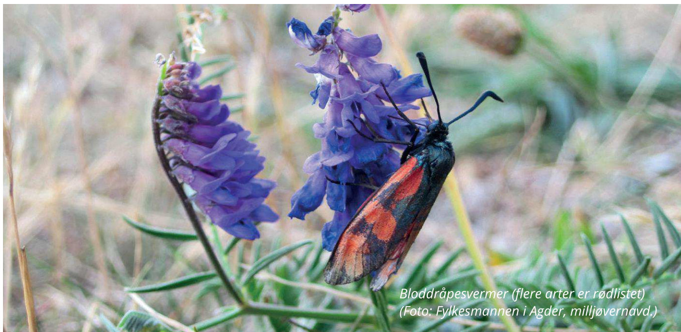
Bloddråpesvermer (flere arter er rødlistet)

Det er kommunen ved kommunestyret som har myndighet etter loven til å gi dispensasjon, jf. pbl § 19-4 første ledd.