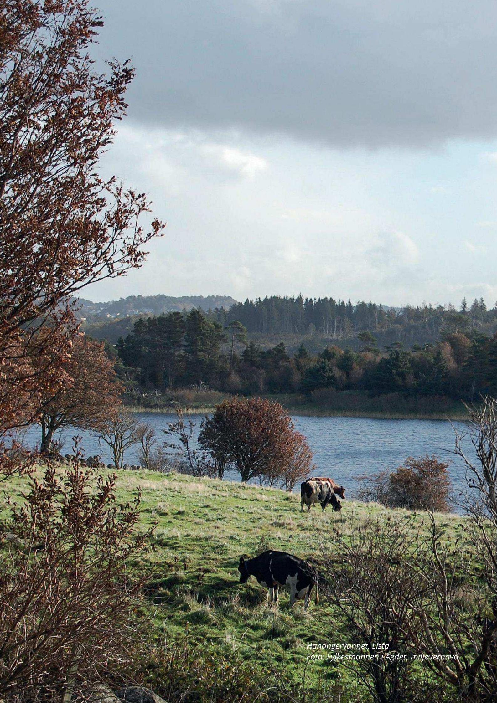
Hanangervannet, Lista