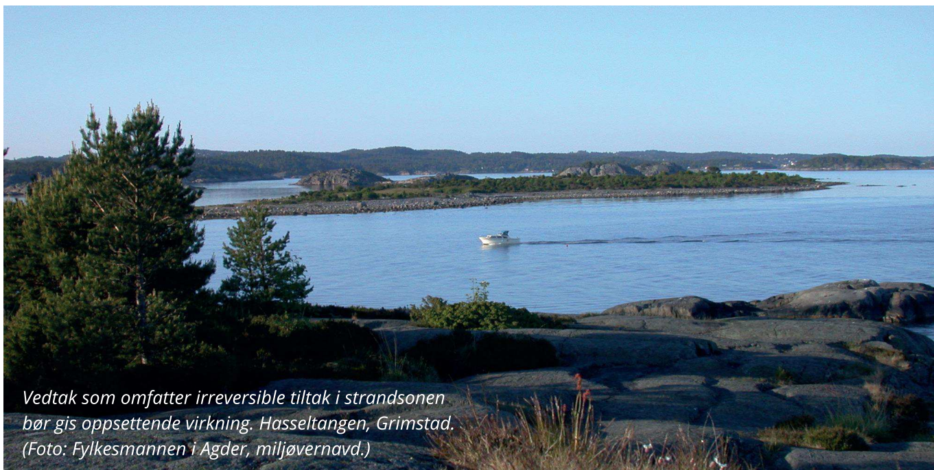
Vedtaket som omfatter irreversible tiltak i strandsonen bør gis oppsettende virkning. Hasseltangen, Grimstad.

Det er imidlertid å anbefale at kommunen ikke gir igangsettingstillatelse før klagefrist på 3 uker er gått ut.