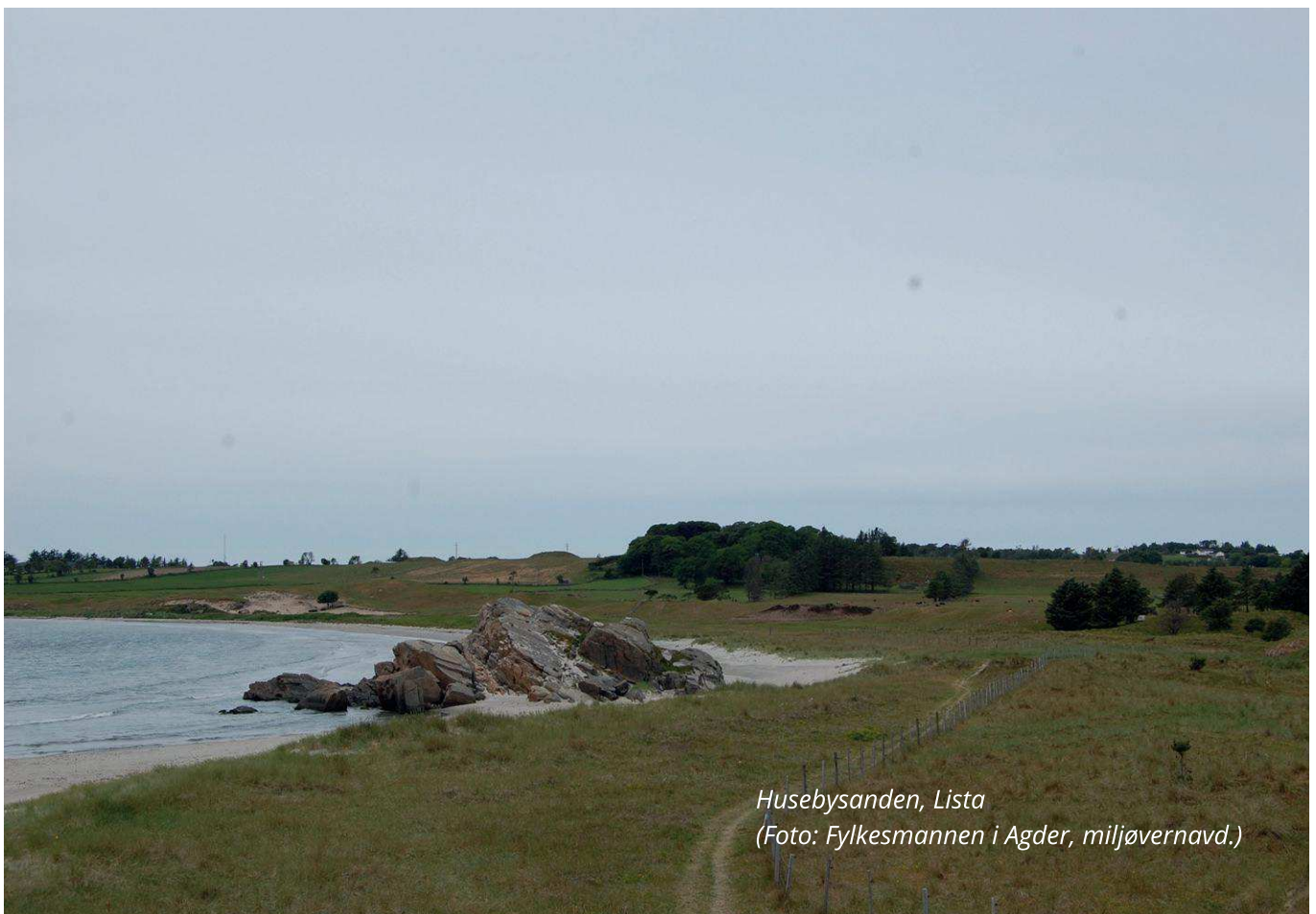
Husebysanden, Lista

Det er særlig viktig å være oppmerksom på kravet til begrunnelse der hvor et politisk utvalg går mot administrasjonens innstilling. Utvalget må da begrunne sin avvikende oppfatning. Det stilles samme krav til begrunnelsens innhold i disse sakene som i de sakene der administrasjonen har begrunnet dispensasjonsvedtaket.