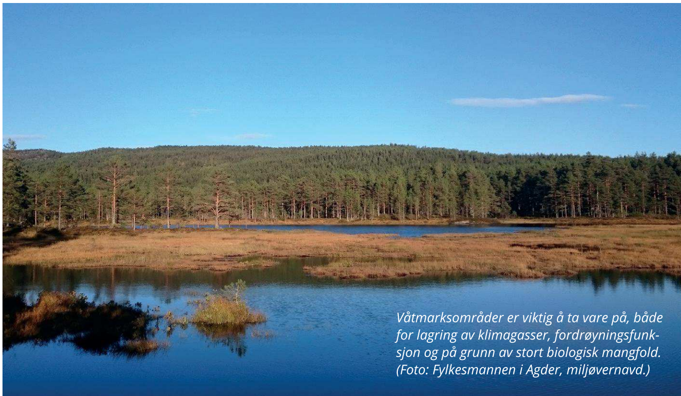
Våtmarksområder er viktig å ta vare på, både for lagring av klimagasser, fordrøyningsfunksjon og på grunn av stort biologisk mangfold.

Kommunal- og moderniseringsdepartementet ga i oktober 2018 ut rundskrivet Samfunnssikkerhet i planlegging og byggesaksbehandling (T-5/18). NVE har også flere aktuelle veiledere, bl.a. veilederen «Flaum og skred i arealplanar», rev. 2014.