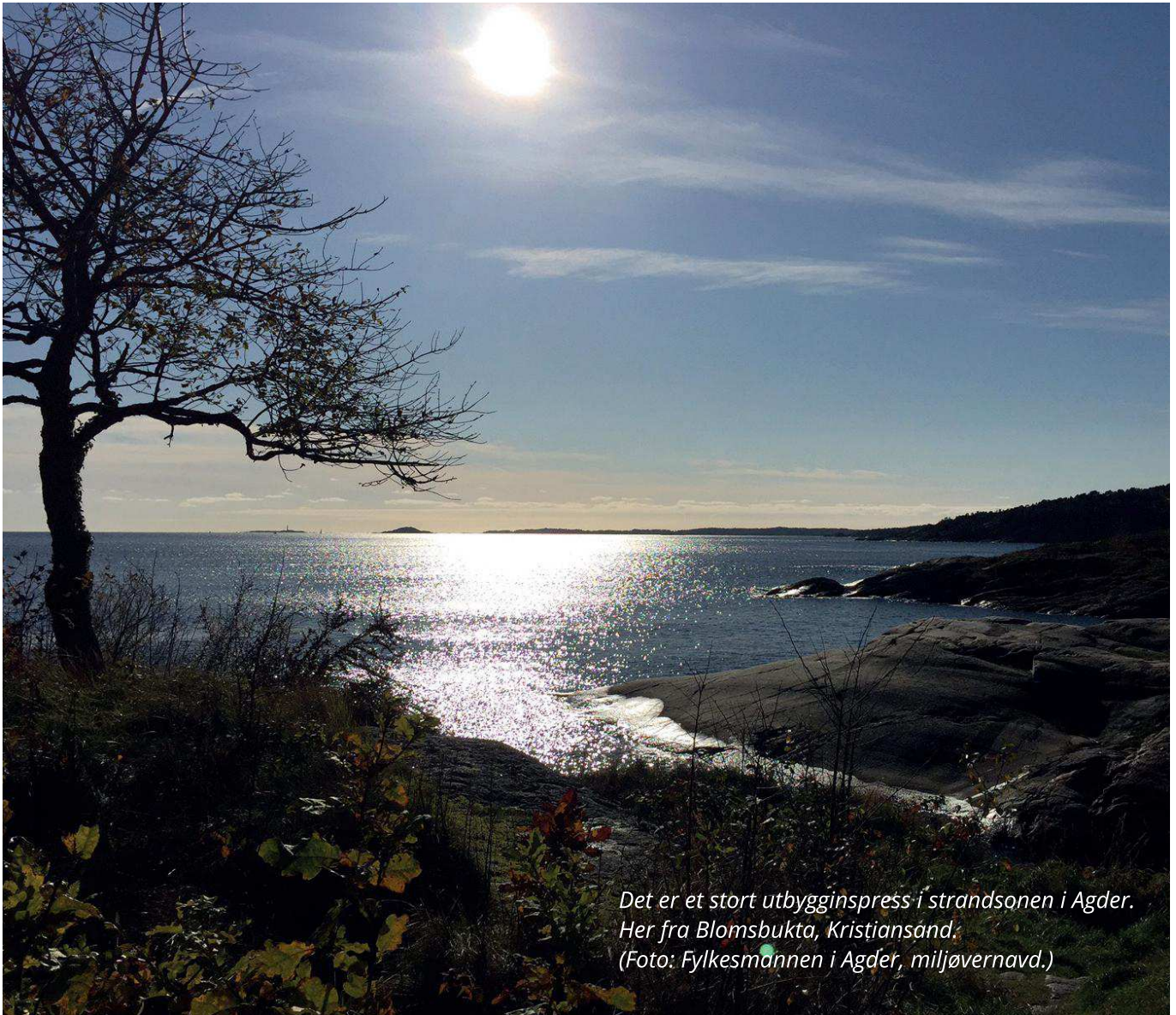
Det er et stort utbyggingspress i strandsonen i Agder. Her fra Blomsbukta, Kristiansand.