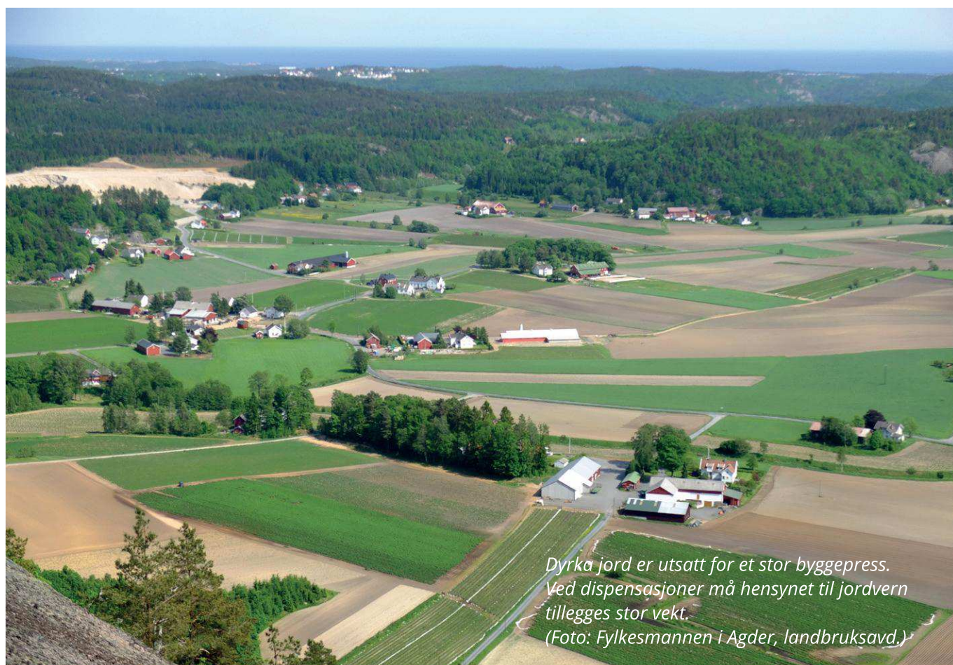
Dyrka jord er utsatt for et stor byggepress. Ved dispensasjoner må hensynet til jordvern tillegges stor vekt.

I dispensasjonssaker som omfatter fradeling og/eller omdisponering av «grønne arealer» i kommuneplan (det vil si som ikke er avsatt til byggeområde), kreves det tillatelse både etter plan- og bygningsloven og etter jordlova. Mer informasjon om forholdet mellom disse lovene er omtalt videre kap. "Sektorlover" bak i veilederen.