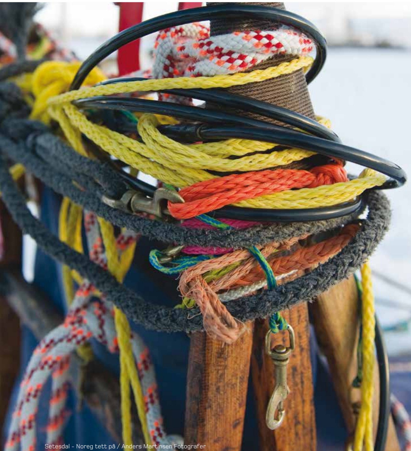
Setesdal - Noreg tett på