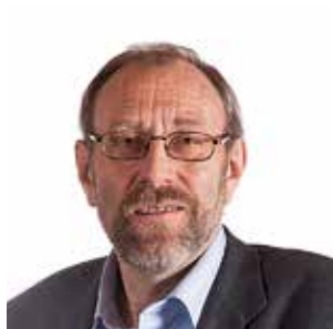
TARALD MYRUM Ordfører Valle kommune