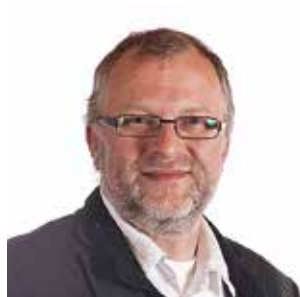
LEIV RYGG Ordfører Bygland kommune