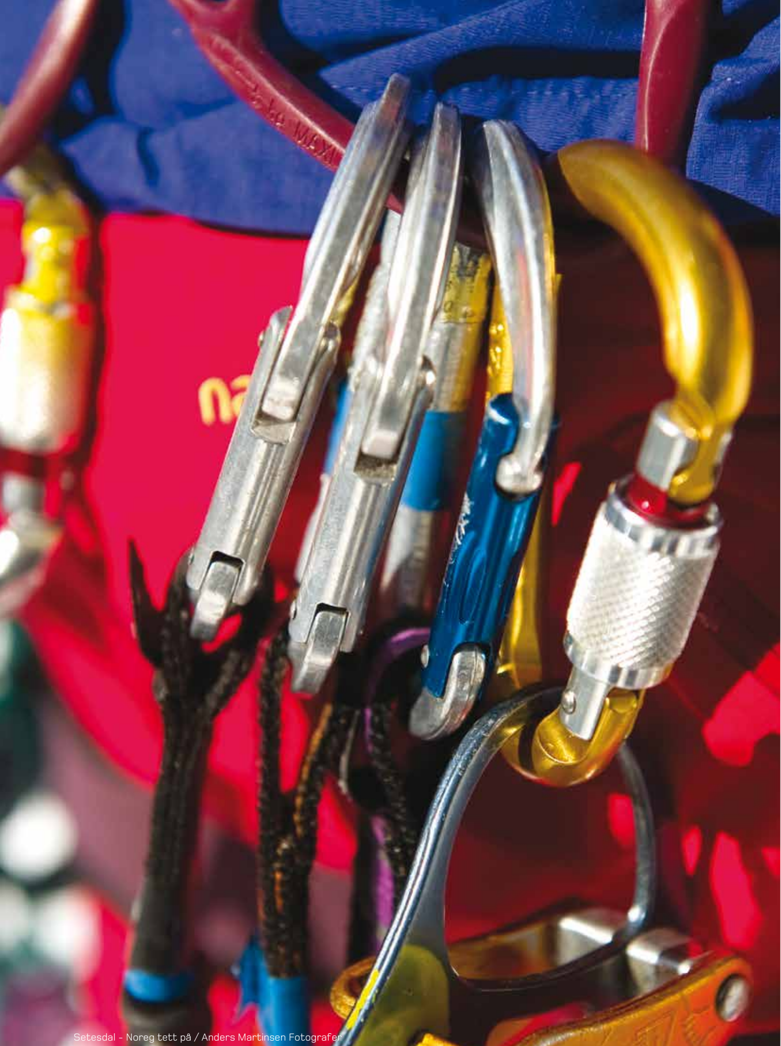
Setesdal - Noreg tett på / Anders Martinsen Fotografier