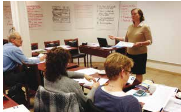
STYREKURS – FASE II Kurset hadde «gullrekka» av førelesarar innfor ulike tema – og studentane ga veldig gode tilbakemeldingar i høve utbytte av kurset.