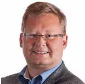
BJØRGULV SVERDRUP LUND Fylkesordfører Aust-Agder Fylkeskommune