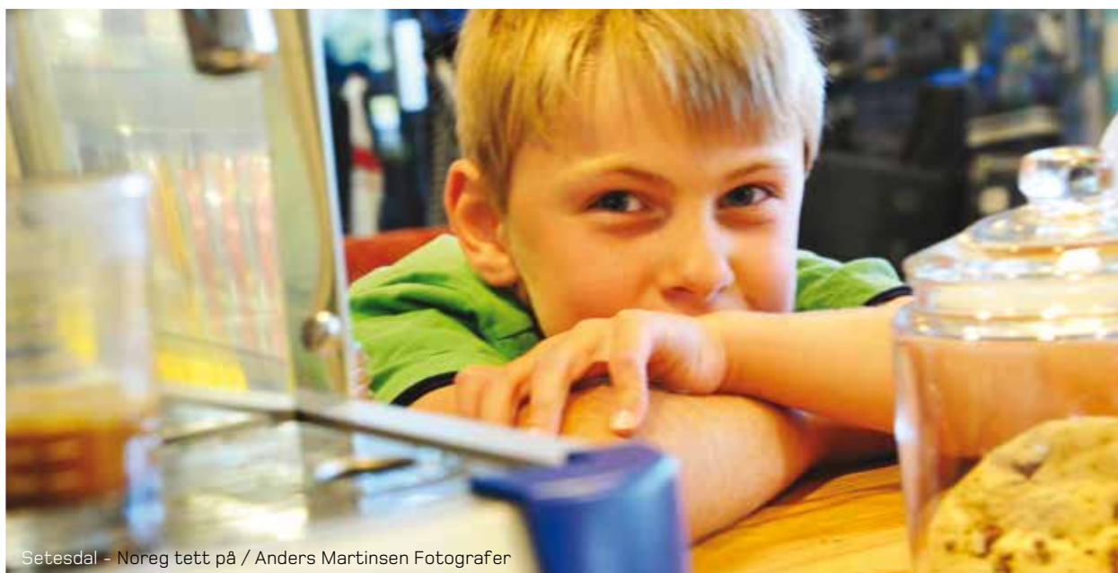
Setesdal - Noreg tett på

Det vart vedteke å sette i gong arbeid med Reiselivsstrategi Setesdal