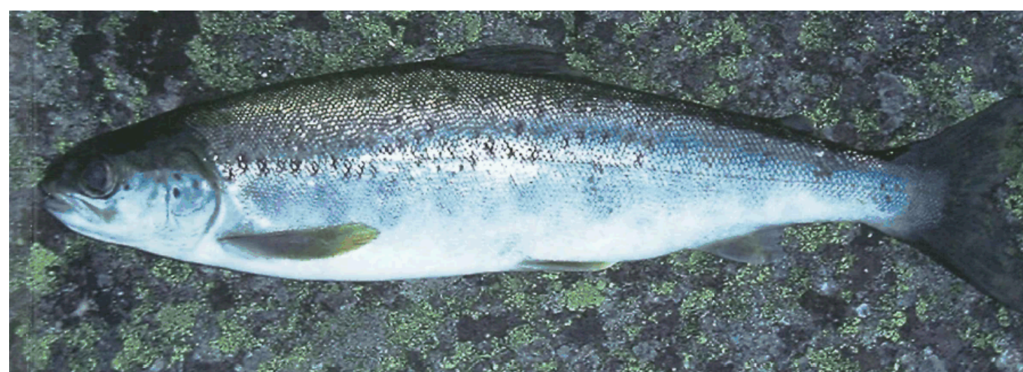
Bleke frå Byglandsfjorden. Die Bleke. Dwarf Salmon.

Bleke. Ei lokal stamme av den atlantiske laksen. Bleka har utvikla seg i Byglandsfjorden etter siste istid. Mest talrik i Byglandsfjorden, men fins i elva sør og nord for fjorden. Sjeldan over 250 g.