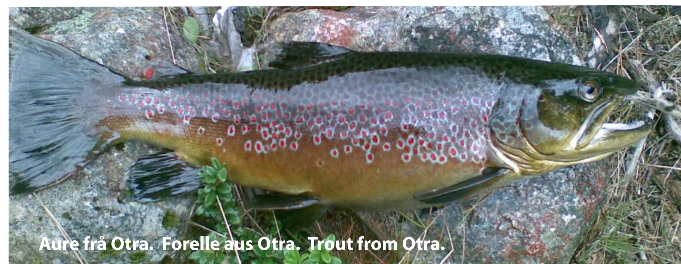
Aure frå Otra. Forelle aus Otra. Trout from Otra.

Eksempel, send til 4740 7900: «SF11D1 Ola Normann,adresse,Postnr» (skriv mellomrom etter kode, ditt navn,adresse,postnummer(4 siffer)). Du får straks fiskekortbevis som SMS og faktura, som bet. innan 14dagar. Kode `døgnkort` (kr 50): SF11D1 `vekekort` (kr 125): SF11D7 `Sesongkort` (kr. 250): SF11S1 (Bet. etter 14 dg. medfører fakt.gebyr kr. 50) Helsing SMSpass DA, mobil 47407900